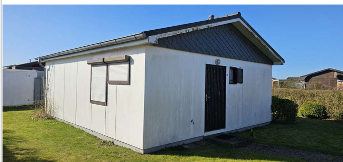
Fenster Bad und Küche

Zimmer: 3,00 Wohnfläche ca.: 47,66 m 2 Kaufpreis: 149.900,00 EUR