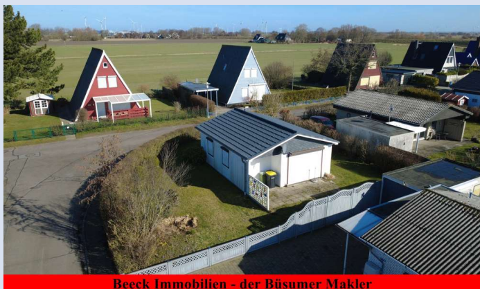
Beeck Immobilien - der Büsumer Makler