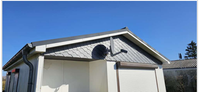
Dach bereits erneuert