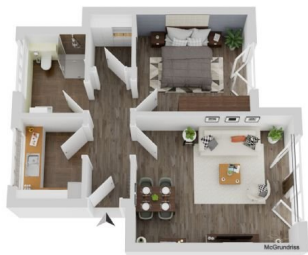
Grundriss Wohnung 1