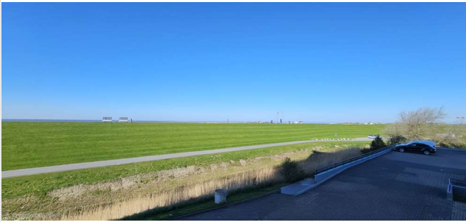
Blick auf den Deich

Zimmer: 1,00 Wohnfläche ca.: 41,14 m 2 Kaufpreis: 150.000,00 EUR