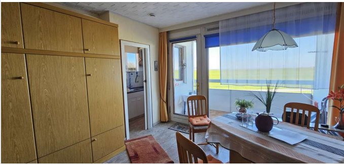
Wohnbereich mit Schrankbetten