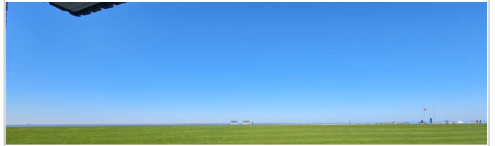
Und auch Meerblick