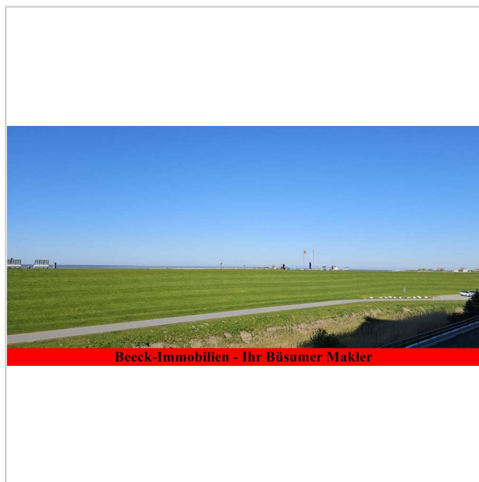
Ferienwohnung mit Ausblick

*Die angegebenen Wohn- und Nutzflächen sind die realen Nutzflächen, entlang den Fußleisten eines jeden Raumes gemessen. Sie sind nicht, wie bei der Berechnung nach DIN, durch Dachschrägen und dgl. gemindert, sondern erfassen die gesamte tatsächlich vorhandene Fußbodenfläche.