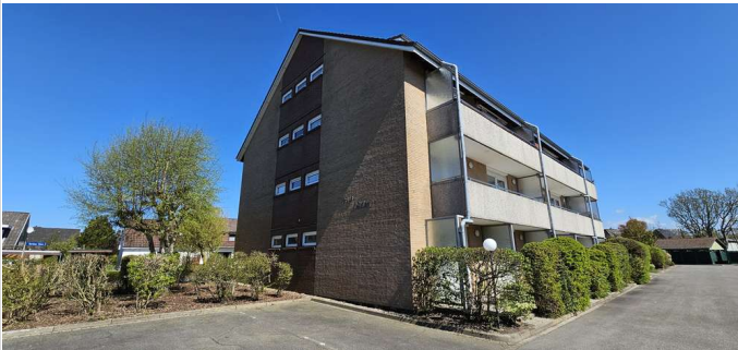
Wohnanlage Haus "Willem"

Zimmer: 1,00 Wohnfläche ca.: 27,00 m 2 Kaufpreis: 125.000,00 EUR