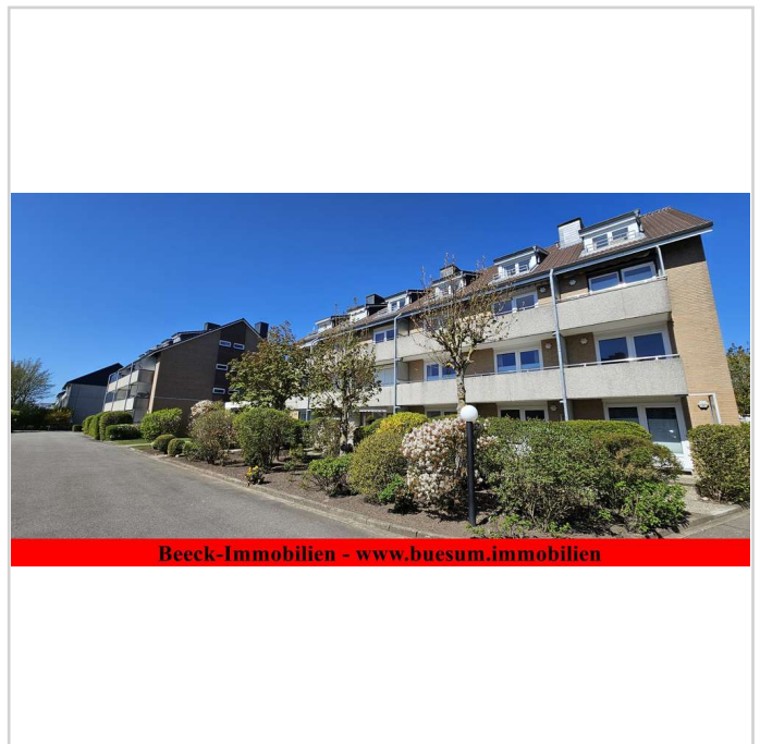
1 RaumWohnung in toller Lage

*Die angegebenen Wohn- und Nutzflächen sind die realen Nutzflächen, entlang den Fußleisten eines jeden Raumes gemessen. Sie sind nicht, wie bei der Berechnung nach DIN, durch Dachsrägen und dgl. gemindert, sondern erfassen die gesamte tatsächlich vorhandene Fußbodenfläche.