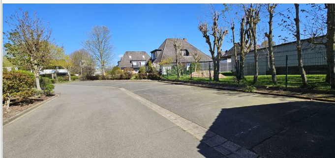
Kfz-Stellplätze am Haus

Zimmer: 1,00 Wohnfläche ca.: 27,00 m 2 Kaufpreis: 125.000,00 EUR