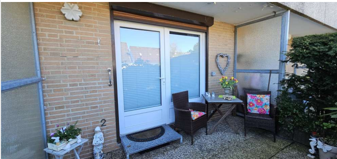
Terrasse vor der Wohnung