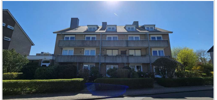
Ferienwohnung im Erdgeschoss