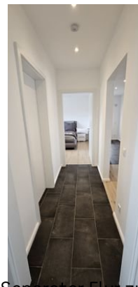
Separater Flur zum Gäste/Kinderbereich