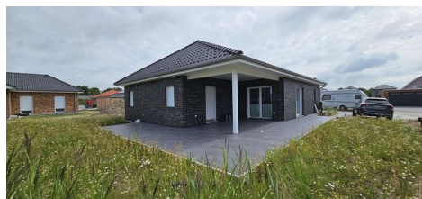
Terrasse und Loggia