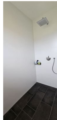
Mit bodentiefer Dusche