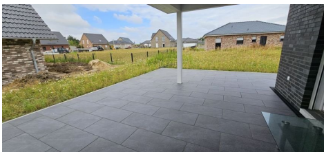
Mit Zugang zur Terrasse