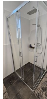
Mit bodentiefer Dusche