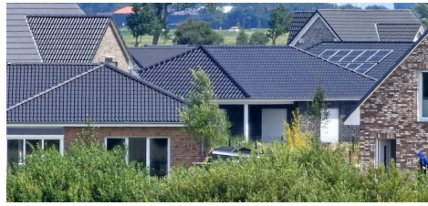
Blick vom Deich