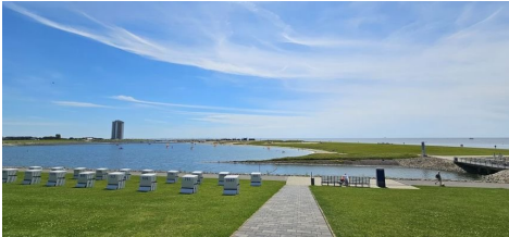
Unweit der neuen Lagune von Büsum