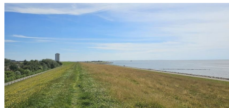
Nordseedeich in Sichtweite