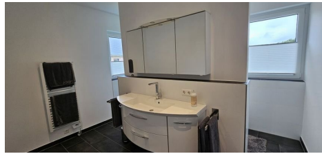
Duschbad & quote;ensuite&quot;