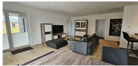
Loungebereich im Wohnzimmer