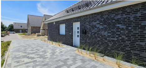
Stellplatz und Hauseingang