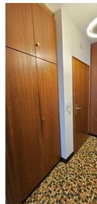
Einbauschränk im Flur