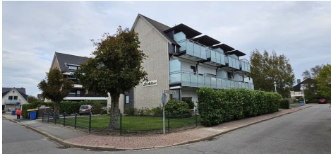
Wohnanlage in der Friesenstraße 2