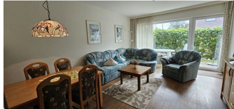
Sehr helles Wohn- und Esszimmer