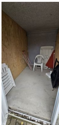
Eigener, separater Abstellraum