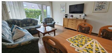
Zugang zur Sonnenterrasse