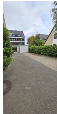
Eigener Kfz-Stellplatz neben der Wohnung