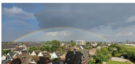
Blick über Büsum