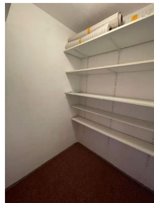
Abstellraum in der Wohnung