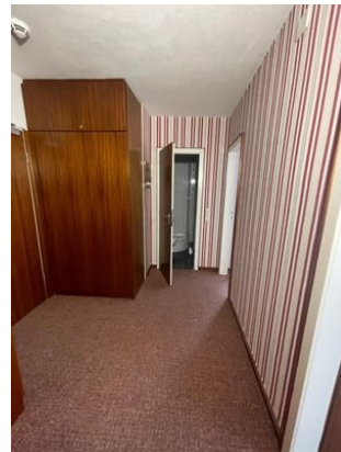
Zugang zum Bad/Schlafzimmer 2