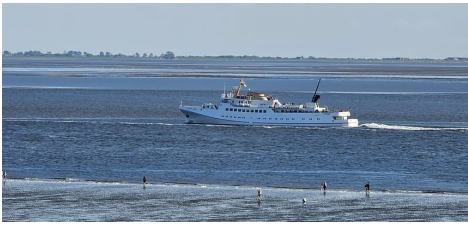
Und die Schiffe