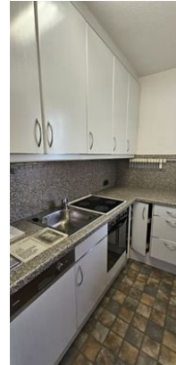
Separate Küche mit Meerblick