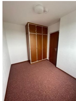
Schlafzimmer 2 mit Einbauschränk