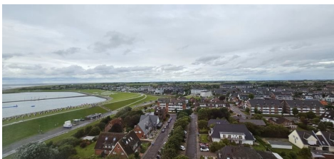
Und Blick zur Lagune