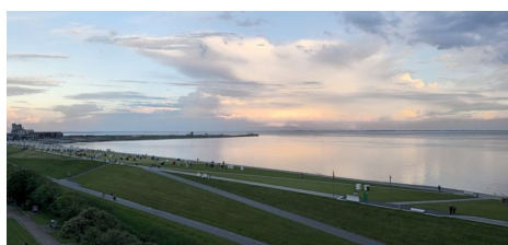
Und über das Wattenmeer