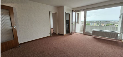
Zugang Küche/Schlafzimmer 1